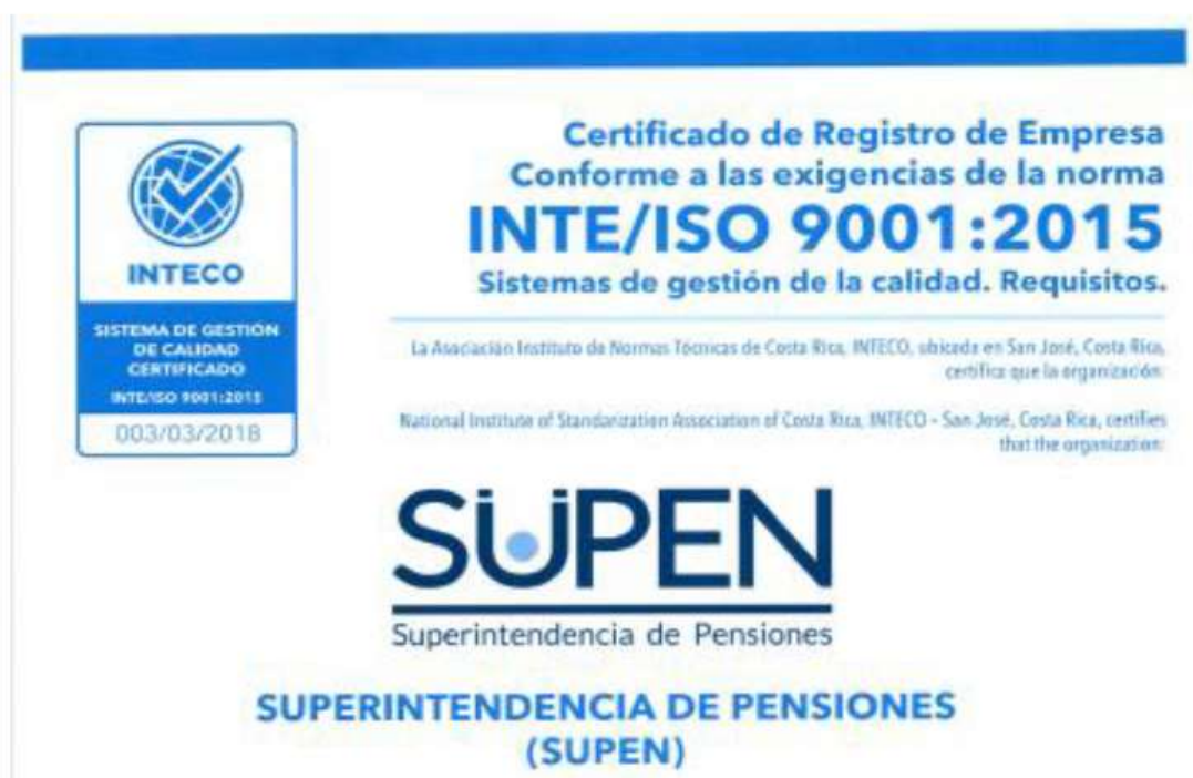
Imagen: Certificación del Sistema de Gestión de la Calidad, 2018

El Sistema de Control Interno de la institución, evaluado a través de una certificación de Calidad ISO 9001, es conforme a todos los requerimientos del ente evaluador.